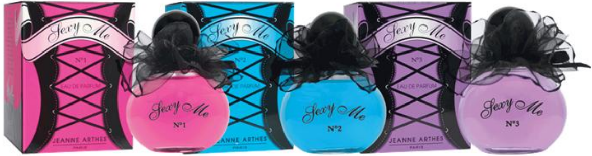
Parfums Sexy Me n°1, Sexy Me n°2 et Sexy Me n°3